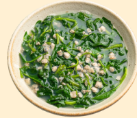
Canh rau nấu Hến 40.000 VNĐ/tô Vegetable Soup with Clams