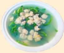
Canh rau nấu Ngao 50.000 VNĐ/tô Vegetable Soup with Cockles

Đặt trước hoặc vui lòng đợi món từ 30 - 40 phút (Pre-order Required; 30-40 min wait)