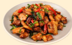
Thịt rang cháy cạnh 150.000 VNĐ/dĩa Stir-fried Caramelized Pork Belly