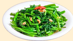
Rau xào (rau khoai, rau muống) 40.000 VNĐ/dĩa Vegetable Stir Fry (Sweet Potato Leaves, Water Spinach)