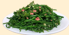
Rau rừng xào thịt hộp 70.000 VNĐ/dĩa Stir-fried Wild Vegetables with Canned Meat