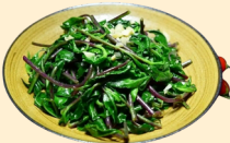
Rau rừng xào tỏi 50.000 VNĐ/dĩa Stir-fried Wild Vegetables with Garlic