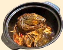
Cá Lóc đồng Kho tộ 150.000-180.000 VNĐ/con Braised Snakehead Fish in Clay Pot