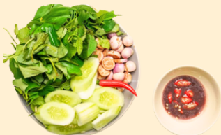
Dưa cà và - 40.000 VNĐ/dĩa Cucumbers, Eggplant Fruit and Fig Salad