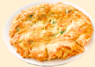
Chả trứng 40.000 VNĐ/dĩa Fried Egg